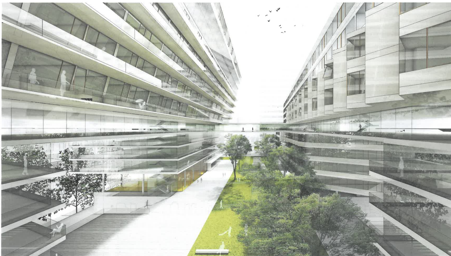
Hochpark auf der Überplattung des ÖBB-Gleisbandes der Franz-Josefs-Bahn, aus der Wettbewerbsarbeit „Althan Quartier, 1090 Wien“ ZEICHNUNG: ARTEC ARCHITEKTEN, WIEN 2018

DIE ÖSTERREICHISCHE FACHZEITSCHRIFT FÜR BAUKULTUR | ÖSTERREICHISCHE POST AG, WZ 022030751 W, ÖSTERR. WIRTSCHAFTSVERLAG, GRÜNBERGSTR. 15, 1120 WIEN, RETOUREN AN PF 100, 1350 WIEN