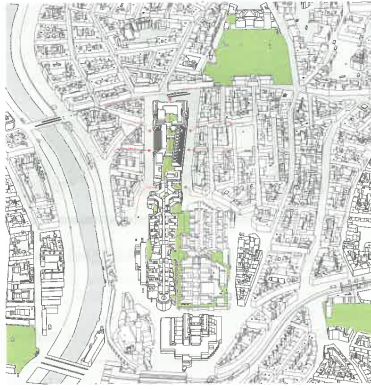
Perspektiven der Querdurchlässe, einerseits gesehen vom Hochpark Richtung Wasserburgergasse, andererseits von der Lichtentaler Gasse zum Hochpark; axonometrische „Stadtübersicht Alsergrund“, von der Spittelau unten bis zum Palais Liechtenstein oben, vom Donaukanal links bis zur Nussdorfer Straße rechts, mittig das bestehende „Althangebirge“ samt erstgerichtetem Wettbewerbsprojekt, aus der Wettbewerbsarbeit „Althan Quartier, 1090 Wien“ ALLE ZEICHNUNGEN: ARTEC ARCHITEKTEN, WIEN 2018

über die Strukturen einer Stadt, kann auch nicht einfach digital herbeigeschafft werden, sondern es ist von schöpferischen Kräften zu erschließen. Es ist eine Hauptaufgabe des Architekturwettbewerbs, das Wissen und die Talente der Teilnehmer für ein Vorhaben zu entfalten, insbesondere wenn es groß und schwierig ist, damit das öffentliche Interesse berührt und die Baubehörde auf den Bauungs-Plan gerufen wird.